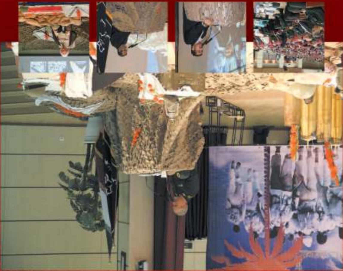
انجمن بزرگوار شہداء کے ذریعے سے ایسے ایسے کام